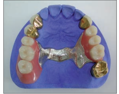
Oberkiefer fertige Arbeit

Sprechen Sie Ihren Zahnarzt an, oder besuchen Sie uns in unserem Info-Center für Zahntechnik!