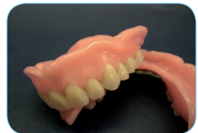
Muskelgriffige Gestaltung der Prothesen

von Zahnarzt, Patient und Zahntechniker gewährleistet sein. Die von den gesetzlichen Krankenkassen für ihre Versicherten vorgesehenen Leistungen sehen dies aber nicht vor. So kommt es dazu, dass die meisten Totalprothesen zwar nach allgemein gültigen mittelwertigen Methoden hergestellt werden, zwar nach bestem fachlichen Wissen, aber eben nur Standard. Zahnarzt und Zahntechniker