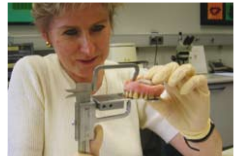
Abb. 3: Vermessung der alten Prothese

zierten den alten Zahnersatz. Die Prothese wurde vermessen um festzustellen, ob die Bisshöhe noch ausreichend war (Abb. 3).