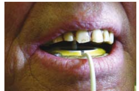
Abb. 4: Sensoraufnahme in der Ausgangssituation

Um einen perfekt funktionierenden und ästhetischen Zahnersatz anfertigen zu können, ist es wichtig, vorher den „richtigen Biss“ des Patienten zu bestimmen. Dies geschieht durch eine digitale Vermessung des Kiefers bzw. der Kaubewegungen. Durch das völlig schmerzfreie Einbringen eines Sensors in den Mundraum des Patienten wird die physiologisch richtige Position der Gelenkköpfe (Unterkiefer) ermittelt und fixiert (Abb. 4).