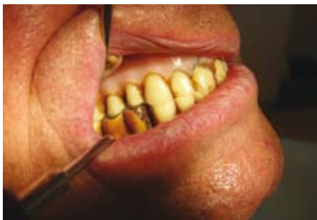
Abb. 1: Ausgangssituation Zahnersatz