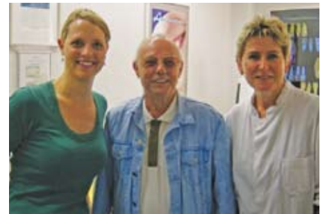
Abb. 10: Ein eingespieltes Team – Zahnärztin, Patient und Zahntechnikerin (von links)

Gerne können Sie uns aber auch ansprechen. Verzaubern Sie Ihre Mitmenschen wieder mit Ihrem schönsten und strahlendsten Lächeln und leisten Sie sich ein Stück mehr Lebensqualität.