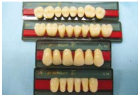
Abb. 8: Auswahl der Zahngarnitur und -farbe

Während der Tragezeit wurden weitere Vorkehrungen für den neuen Zahnersatz getroffen. Eine persönliche Beratung für die Zahnfarbbestimmung und die Auswahl der Zahngröße wurde durchgeführt (Abb. 8).