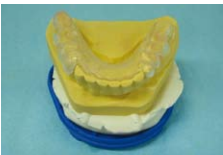
Abb. 7: DIR® Schiene aus glasklarem Kunststoff

Es wurde eine sogenannte DIR® Schiene für den Patienten angefertigt (Abb. 7).